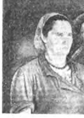
Адуулжа, шэгнүүрые нэ- мээжэ аргатай байна ха юм.

багагай, жэжэ, туранхай мал тушаана абаад, тэднине гурба хара соо ша- хажа, тарган, дундаһаа дэ- шэ шадалтай, тус тустай 3,5—4 центнер татаха бол- жо мяханай комбинадта лбуулаад юм. Мал шахаха гэжэ түхээрэгдэн долоош үбэ байра соо намартаа, үбэдөө нэгэ доро 2500 үхэр байлгадажа эдэлүү- лэгдэнэ. Харин хабар-зунай сагта тэднэй зарим тэды үсөөрлэд. Үбнэ тэжээл хо- мор болоно, мүн энэ үдэ үхэр- нүүды ажахи бүхэн өнө- дингөө бэлшээрн дээрэ