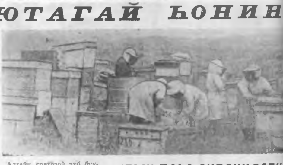
Алтайн совхозой түб буураһаа ходохон бэшэ газарта зуга үхэбэрлэгшэдэй байрыг тухээрэгдэнхэй. Хэдэ эртэ үгөөгүүр байгааше наан, энэр зугагшадэй ажал охилхэнхэй байгаа һоп. Байрыг тойроод үнгэ бүрингээсэг набшаар надхан үргэнэ тала.