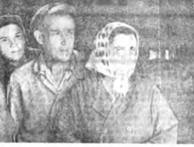
Адуулжа, шэгнүүрые нэ- мээжэ аргатай байна ха юм.

гэгшад үхэр бүхэнэйгөө шэгнүүрые бүрише эхээр заримдаа сүүдхын 1000 грамм хүрээр нэмээжэ. Зунай үдэ олонхи бай- рануудай сүүлэ байһание харада абаяа, нёдондо т- жо мяханай комбинадта лбуулаад юм. Мал шахаха гэжэ түхээрэгдэн долоош үбэ байра соо намартаа, үбэдөө нэгэ доро 2500 үхэр байлгадажа эдэлүү- лэгдэнэ. Харин хабар-зунай сагта тэднэй зарим тэды үсөөрлэд. Үбнэ тэжээл хо- мор болоно, мүн энэ үдэ үхэр- нүүды ажахи бүхэн өнө- дингөө бэлшээрн дээрэ