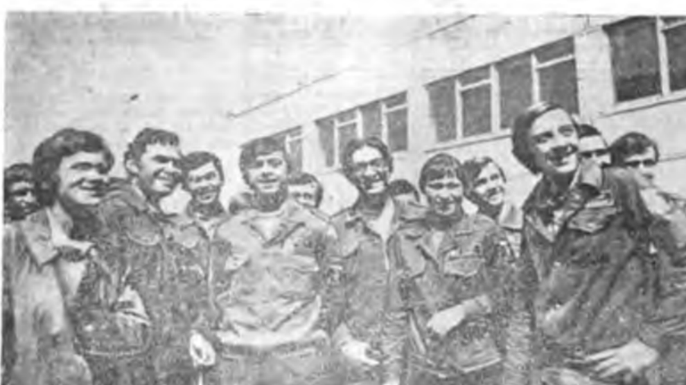
ЗУРАГ ДЭЭРЭ: «Алтан» отрядтай бетонцигууд.

ХАРЬКОВСКА ОБЛАСТЬ. Днипр—Донбасс гэзэн каналай 260 километрэй набын Лозова хото шадархи участка барилгын хүдэлмэри эдэхитэйгээр хэгдэжэ байна.