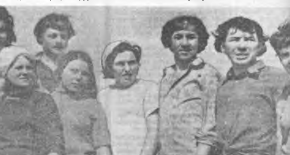
«Атлант» отрядтай дневник соо тусхай тэмдэглэл хэргэдэг. «Юнош» отрядтай 23-ай хүдэлмэрин урар советсэй ба ветнамыс залуушуулай хани нүхсээдэ зориулагдана. Ханойн Пионерүүдэй ордонхой барилгын жасада 350 түхэргий оруулагдана.