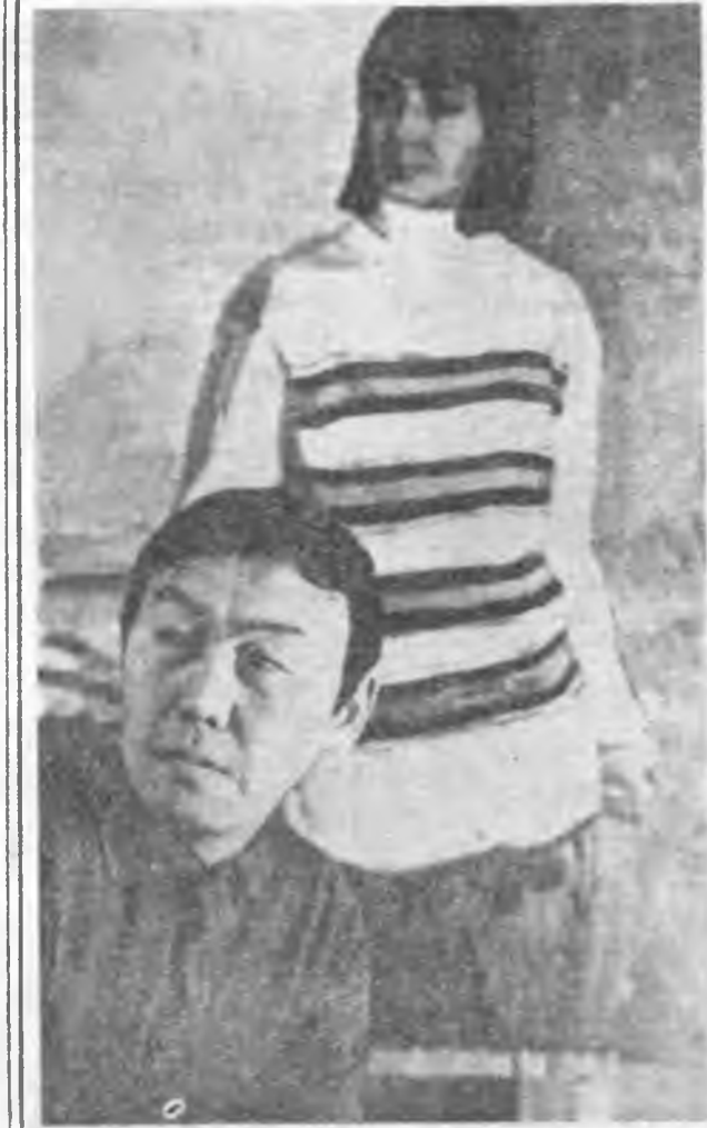
Уран зурааша К. Дүльбеевэй нэрэ олондо мэдээжэ. Тэрэнэй зураһан тодо хурса пейзажууд, хүнэй доторой байдал уран зохиодор харуулан портретүүд манай харашалдай дүрэ сэдхэл буланхай.

Бэлтгэ уран зурааша өөрынгөө бүтээлүүдэ ажалай түрүүшүүдтэ, хүдэлмэришэн хүнүүдтэ зориулжа байдаг. Жэшээлхэдэ, уран зурааша Эддын аймаг ошожо, тэндэхи түрүү наалшадай, механизаторнүүдэй хэдэн зураг урлажа ерһэн байна юм.