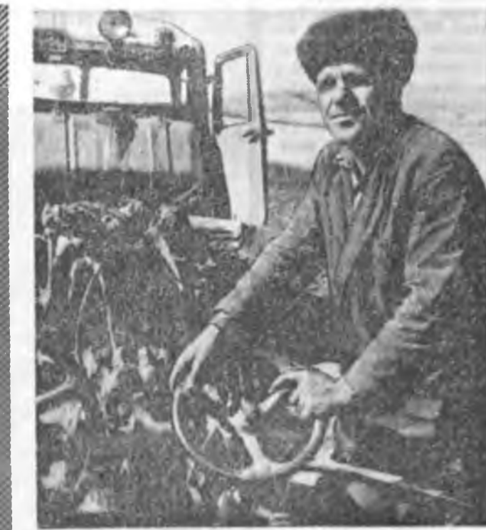
МУХАР-III БЭЭР марай наар ехээр үдэр даэ Зааной колхоз тракторной бригаданы 4-дөхи бригадын ханизаторнууд харуурагдан даабаряа буюу...