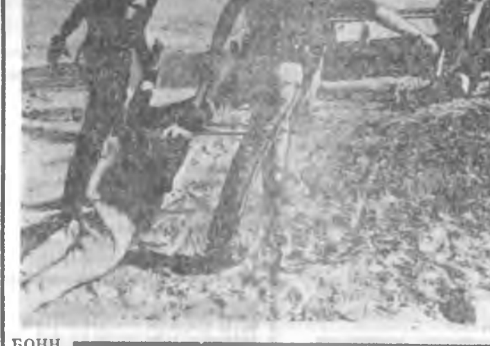
В. БРАНДТЫН МЭДҮҮЛГЭ

ЗУРАГ ДЭЭРЭ: буналгаанай хүлээрхэй нэгэ үзэгдэл харанат.