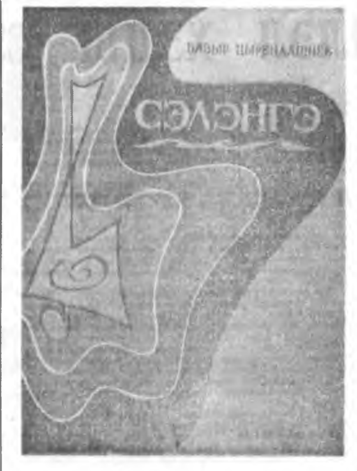
ШЭНЭ НОМ ДУУНАЙ СУГЛУУЛВАРИ

РЕДАКЦИНАА: Энэ бэш-тэ голтоодоо, ямар ушар-наа боложо, манай газетын номернууд алгасалданб гэ-нэ асуудалтайгаар Бурлад үнэн АССР-эй хэлхэс холбоо-ной үйлдвэрчин-техникшье шуралтын хүдэлмэрлэгшэ-дэд хандажа, дүтэн салга харюу абаха байхандаа най-данабди.