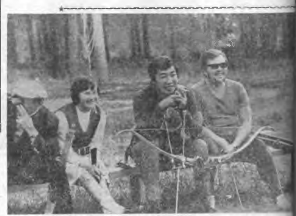
МЭРГЭШҮҮЛЭЙ ШУРАН ГОДЛИНУУД