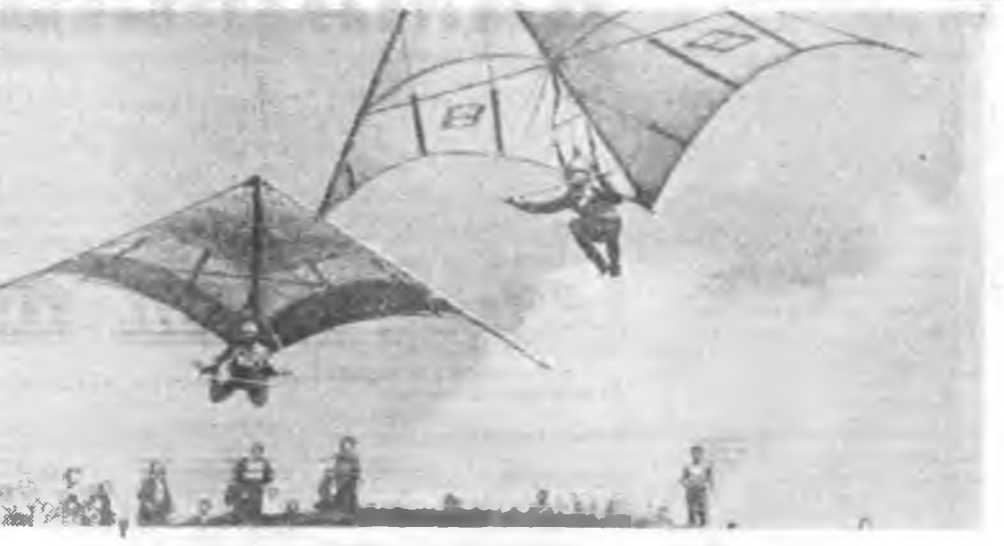
МОСКВА. Дельтапанаар ниндлэхэ дуртайшуул натай ороһоо олоһоргоо байна. Энэ зүйлээр түрүүшн мурсыон түб хотын Крымскскы гэжэ канал шадар боло.