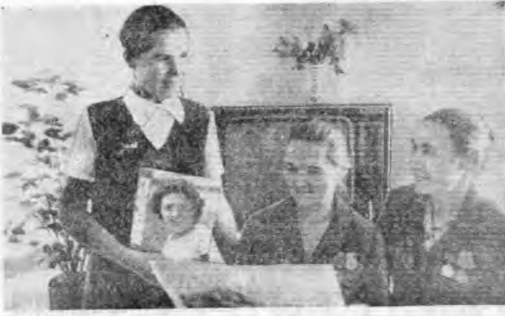
ҮНДЭР ДҮНГҮҮДЭЙ ТҮЛӨӨ