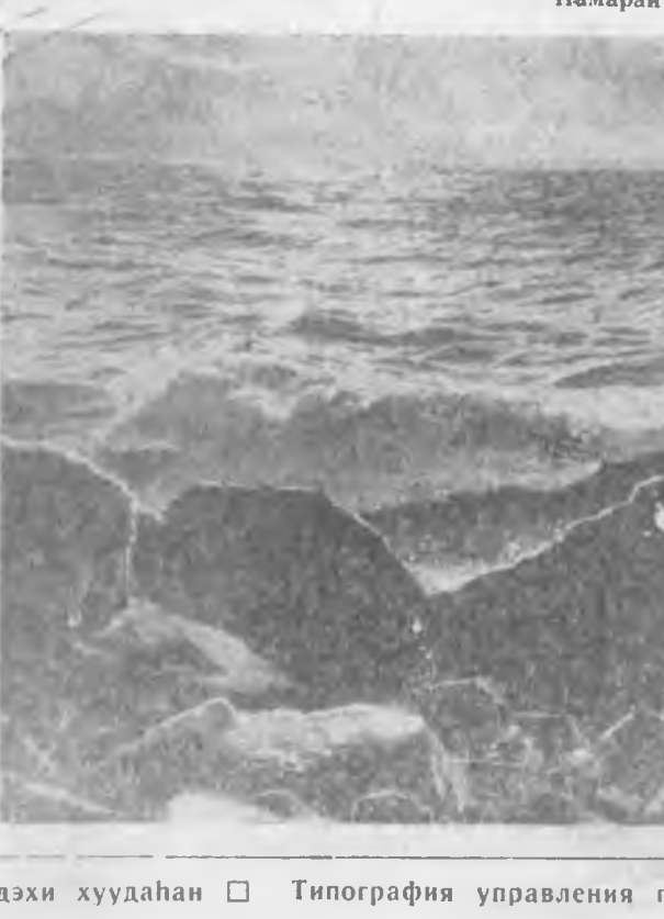
Түрүүшын саһан. Намарай Байгал.