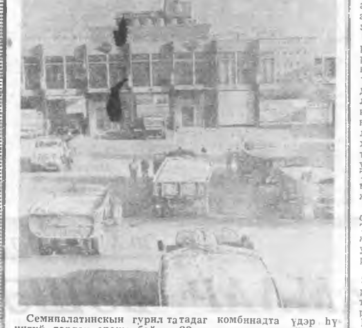
Семиналатинский гурья гатадаг комбинатта үдэр һунигай тарган орожо байна. 60 тонно шэгүүртэй түмэр ламай вагоной аша 15 минута соо буулгаха түхээрэлтэ эндэ тодхогдонхой.