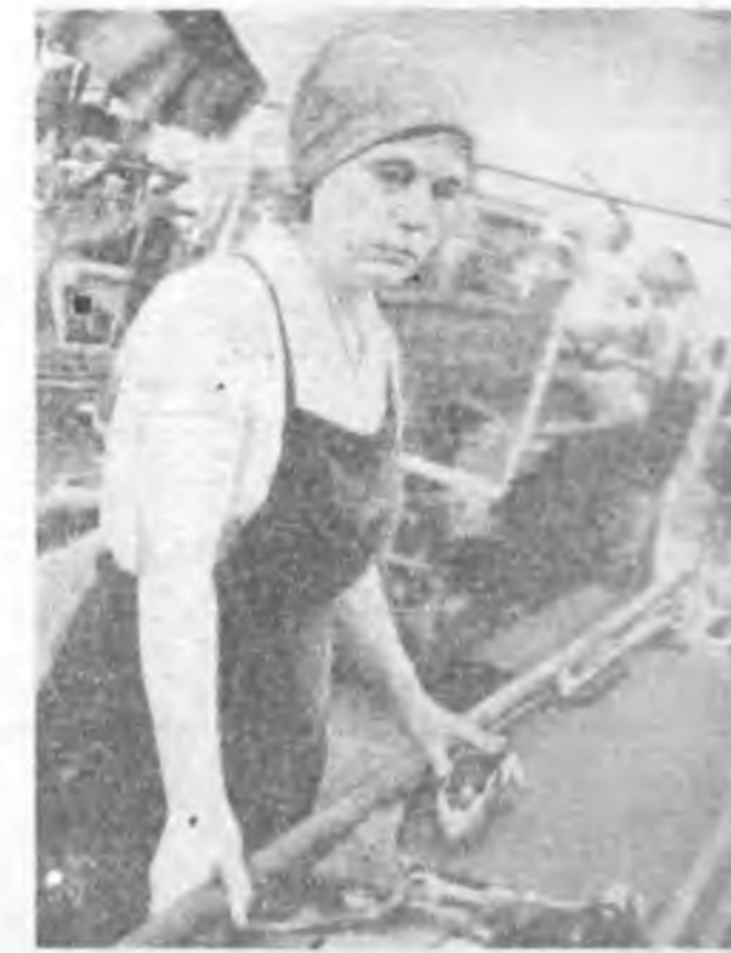
Улаан-Удын нарин сэмбын комбинатда жэлэйнгэ даабари болзорхоон урид дүүргэһэн хүдэлмэришэд үдэрһөө үдэрт олошорно...