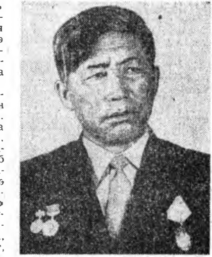
— табан жэлэй һүүлшын жэ- манда бурнишэ ехэ амжилта ас- раа. Тэрэ жэл бидэ зуун эхэ хо- нин бүхэнһөө 118 хурьга тулжүү- лэһэмди. Аймагай чемпион тэ- һэн нэрэ зэргэдэ хүртэхэ зол ху- ры үршөөгдөө бэлэй.

Тэнхээнь буладхангүйгээр ондо оруулахан, нарай хурьгадаа тобиржуулан найнаар тулжүүлхэнэ тон бэрхэтэй ха юм даа. Дүй дүршлэй болонхон уннэй хоншошон бүхэн лэ нимэ тобиолод лэб хэжэ байха. Малай үбэлжэлгэе, илан-гаяа тул абалтын, тулжүүлгын сагые эрхим бэлдэхтэйгээр утгаха эрилтэ табигдахышэ ёһотой.