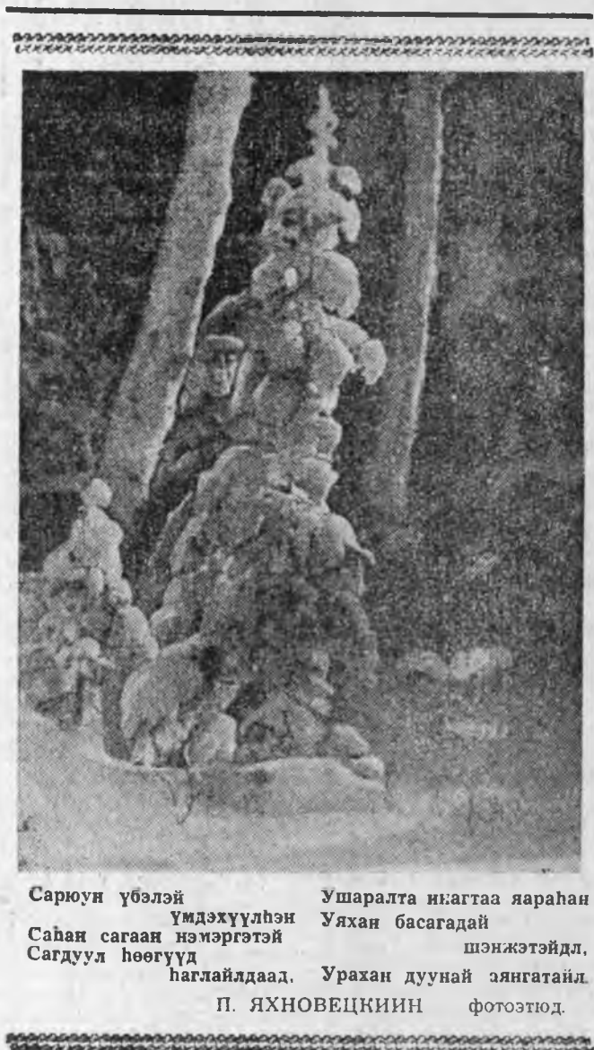
Сарюун үбэлэй Ушаралта нутагта яарахан Уяхан басагадай шэнжэтэйдл. Урахан дуунай яангатайд.