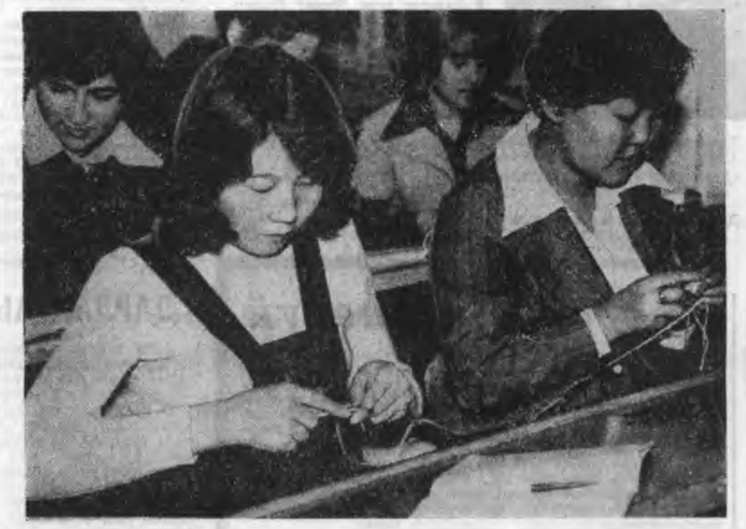
Доржи Банзаровай нэрэмжитэ багшарнай институтай нийтэн мэргэжлэй факультет 1977-1978 онуудай хуралсалхай жэлдэ шэнээр нэгэ дэхэ хэбтэ хураана.

ЗУРАГ ДЭЭРЭ: үбэл