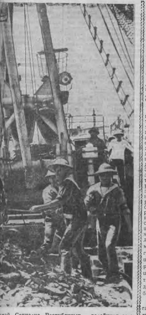
Социалист Республика далайнууд гаран байн юм. Гурин далайн хүдэлмэрилдэгшдөө эр эмсэгүүдээр ханга хэрэгтэ гол анкарал Орон дотор далайн гүлмээ нээжэ хүдэлмэриг эр аюулагдана. Яахан ороной эгээл томо далайн гурин Дабак ашагалгада тушаагдаа. Вьет. загашадгай 600 кооператив эмхидхэгдэнхэй.