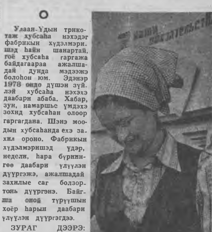
Улаан-Удын трнко-таж хубсаа нэхэдэг фабрикийн худалмэришад найн шанартай, гоё хубсаа гаргажа байдагаараа ажалдай дунда мэдээжэ болоһон юм. Эдэнэр 1978 ондо дүшэн зүйлэй хубсаа нэхээ даабари абата. Хабар, зун, намаршы үмдэхэ зохиод хубсаан олоор гаргадана. Шэнэ моодон хубсаанда эхэ захлы ороно...