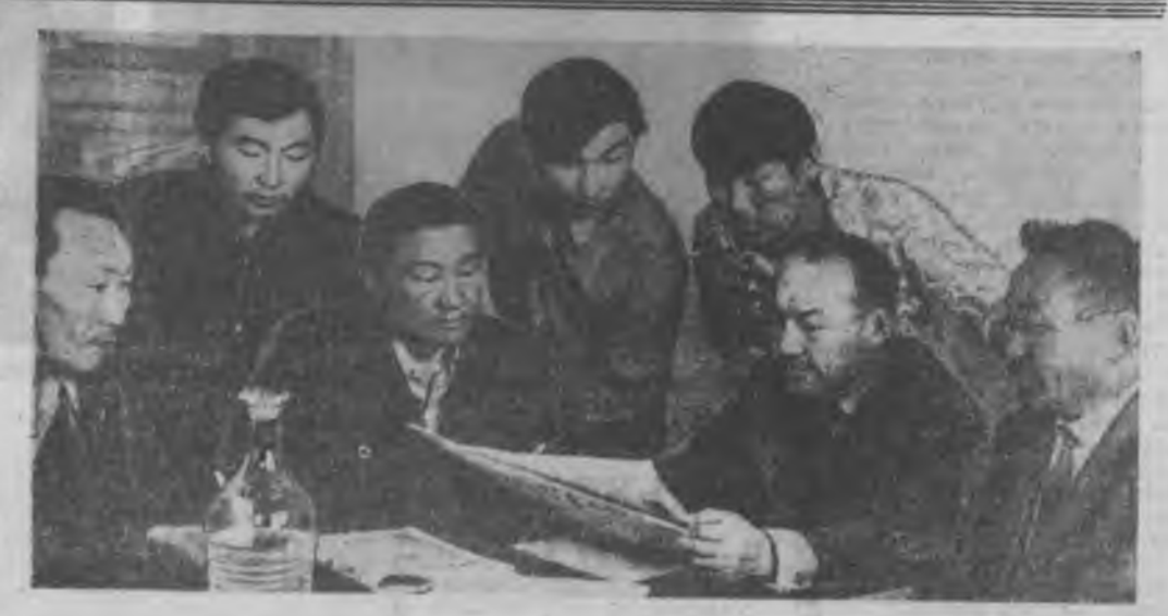
Литература нэгдэлдэй гэмшүүд байд гээд эз бутдааа сулгаржа, бээ бэмнээ бэмнээ зохиолуудые үншээд, һонир-холтой зүбшэл заабари хэлэжэ зангал-тай. Мүн тэднэр литературны теори шудалдаг юм.

Холын айлан шубууд — түбэн сагаан хуууд — аажам куурта буун, амарна ха, ал-бун. Шинин эрээдэ дүтхэн шуганаш, тамарнаш хамаагүй. Шубуудай нэгэн мэтхэн шэртэдэ шамай халаагүй... Удаань уһанһаа гаран, эрээ дээгүүр гүйншэ, Урдана ялагар наран, үбсүүн, бээ дээгүүрш! Айлан шубуудай нэгэн айха гэхээ болшоо... Нүгөөднэ юушьеб гэж, яэр һурагуй боһошоо... Тэдэ хоёрые харахада, тоосоонһыг тэн ойлгосотой Зүбшын гэжэ хэлэхэдэ — жүтөөрхэдэхэн тон ойлгосотой!