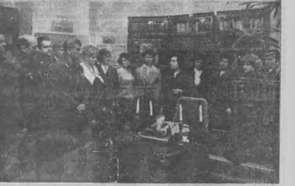
Кремль. В. И. Лениней кабинет соо, ТАСС-ай фотохронико.