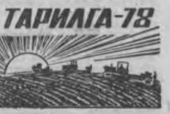
ТАРИЛГА-78 Арбадахы табан жэлэй туршада хүүдэ ажахын гол продуктуудые бүри эхээр абажа, гүрэндэ худалдахын тула нэн түрүүлэн газарайнгаа үржэл хайжаруулаһан ашаар ороноо тарянаа, гэжээлэй ургамалуудай болон ногооной ургаса эрид дээшлүүлхэ байһанмай эхэндэшые мэдээжэ. Тинхэдэ бидэ газараа эзэн ёһоор ашаг үрэ эхэтэйгээр хэрэгтэй ёһотой болондохэ Энээнэй ашаар лэ тогууригтай һайн ургаса ханаажа, нинитыгээ адууһа малай ашаг шүүэ арга байса дээшлүүлхэ арга олгодохо байна бшуу.

Мүн Доодо-Ивалтада һаанин малай комплексын бодлоогдон ушарһаа тэндэ хайжаруулагдан бэлшээрй бин болонхой. Тинхэжэ бүхыдөө 150 шахуу гектар бэлшээрин газар уһаладаг болоо һэн.