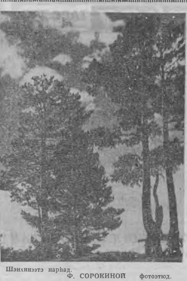
Шэнхэнэтэ нарһад.