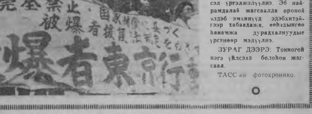
«Ядерна, тэрэ тоодо нейтроны буюу зэбсэг эссэ-лэн хорихо хэрэгтэ япон арад эдөхитэйгээр хабаа-дана» гэһэн уриа дор тэмсэл үргэлжэлүүлэ.

хардуу байдал тохолоууладг Пекиний хүтэлбэриг лэштэй экспансионист эрилтүүдые буруушаанабди.