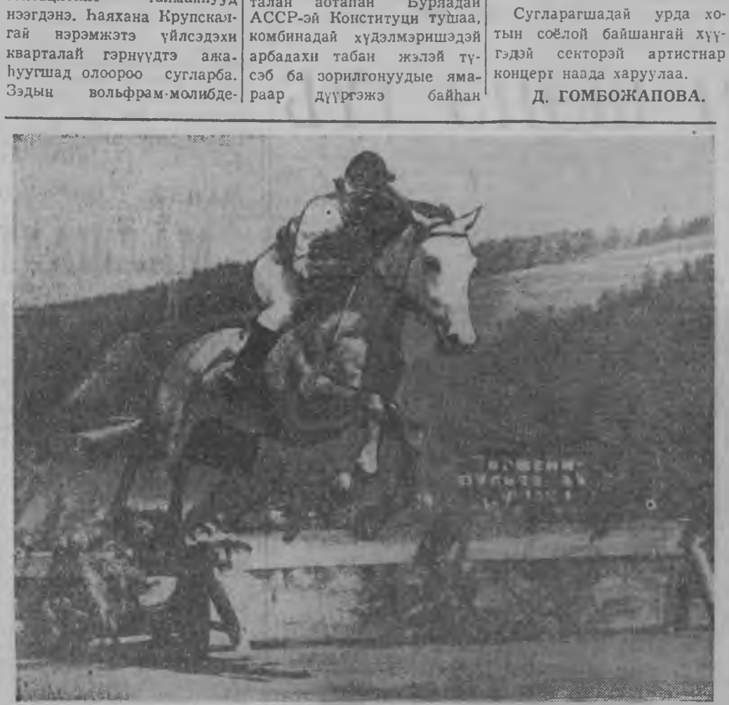
Зунай хабада Улаан-Удын ипподром дээр эхилдэг заншалта мори урилдаа хахаха дуртайшуудай тоо үрбээр...