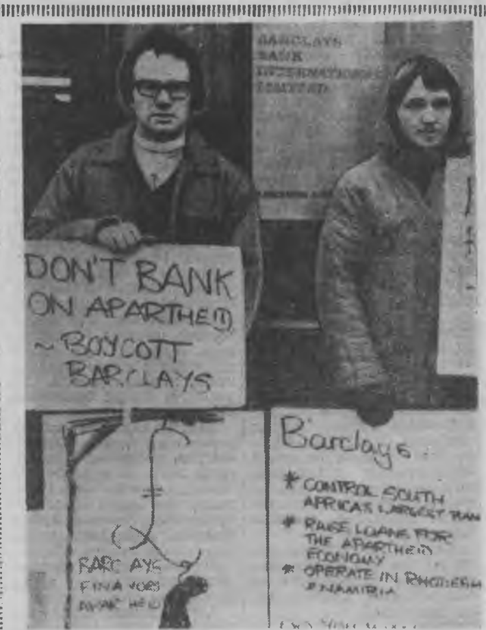
ЛОНДОН. Арад зондо эсэргүү Африкын Урда зүгэй засаг баригшадта «Барк-лейс банк лимитед» гэжэ банкын мүнгэ зөөрин тал-лаар ехэ тууламжа хүргэ-дэгые буруушаан жагса-алиуд эндэ боллоо. «Ур-да Африкда үрхалаймаа үгэлгыс болуулаа» гэнэн ТАСС-ай фотохронико.

Совет коммунистууд, ма-най оройно олонитэ зон СКЮ-гай XI съездин хүдэл-мэрийд нохирхохо байна. Аха дүү коммунист партинууд ба арадуудай дүй дүршлээр нохирходог ушар — комму-нистуудай, үргэн олон ажалшадтай интернациона-ла ёноор наанаа нэгдэл-гын олон тоото гэршэнүү-дэй нэгэн боллоо. Энэ ха-даа дэлхэе революциомо ёноор шнээдхэхэ хэрэгтэ парти бүхэнэй, арад бүхэн-эй оруулдаг хубитыс хүн-дэлэн байгуулахын түлөө тэм-сэлтэ бүгдын үндэһэн зор-илгонуудай адал байһые мэдэрһэн абалд боллоо. Манай делегаци Югосла-вин Коммунистуудай Со-юзан Түрүүлэгш нүхэр Но-сип Броз Титын эидхэлхэс эхэ анкаралтайгаар шагнаа. Экономикын, ардм болон соёлой, мүн социализм бай-гуулаатын бусад налбарн-нуудай талаар туйлагдан амжалтанууд эйдлэх соо, съездын делегатуудэй хэл-нэ үгэнүүд дотор дэлгэр-гынээр дурдагдаа, нийтлэн-политическэ байгуулаатын хүгжэлтэ элэрхэйлэн харуу-лагдаа. Мүнөө сагай гол а-суудан хани холбооной ба нэгэдэлэй шаашада бэх-нэжэлтын шухала байһанын тусхайлан тэмдэглэгдэ. СКЮ-гай XI съездын хү-дэлмэриин харахата, юго-слав обществын хүгжэлтын шухала асуудалнуудта энэ ехэ хуралдаанай гол анка-рал хандуулагдаа. Югославин коммунист-нууд оройноого ажабайдал-тай шухала асуудалнуудыс шидхэдэг хүдэлмэриинд ангин, тэрнэй гол хүсэн бологшо Коммунистуудай