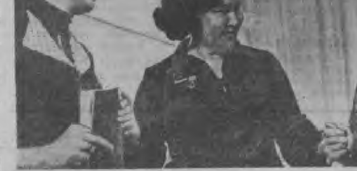
МОСКВА. П. И. Чайковскийн нэрэмжэтэ Удасхооронд VI конкурс. ЗУРАГ ДЭЭРЭ: душадай жорин түрүүлгэшэ, СССР-эй арадай артистка, Ленинскэ шангай лауреат Ирина Аркин