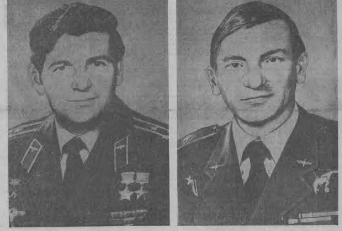
«СОЮЗ-30» ГЭЖЭ ОНГОСЫН КОМАНДИР ПОЛКОВНИК ПЕТР ИЛЬИЧ КЛИМУК