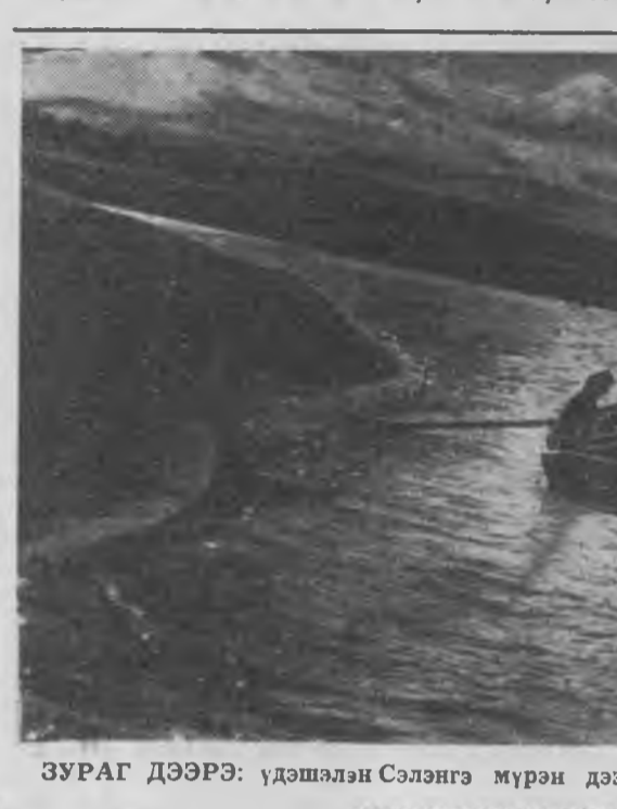
ЗУРАГ ДЭЭРЭ: үдэшлэн Сэлэнгэ мөрэн дээрэ.

Хабарай найхан саг нэн. Урда Туснын тала дайда хүхэ мананда хушаганхай.