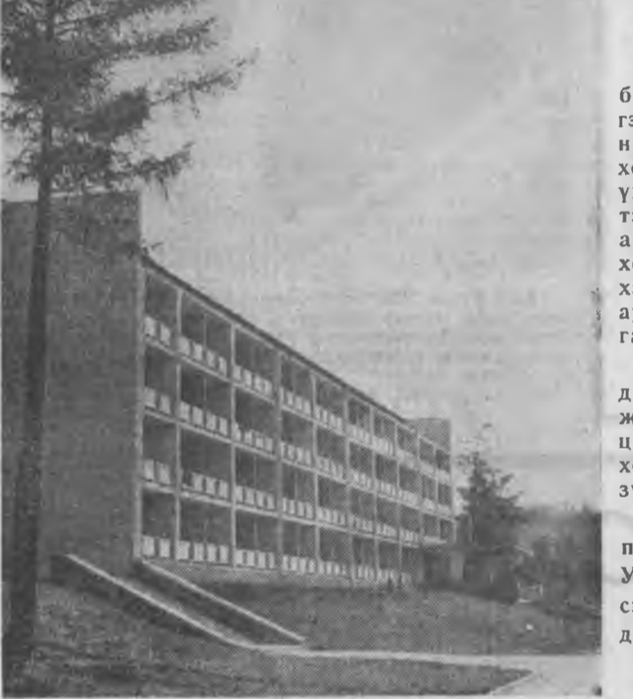
Тойроод үзэхэлэн гоё байгаалтай. «Котокель» гэжэ амаралтын пансионат энэ жэлдэ түрүүшынхэ нээгдэнэн юм.