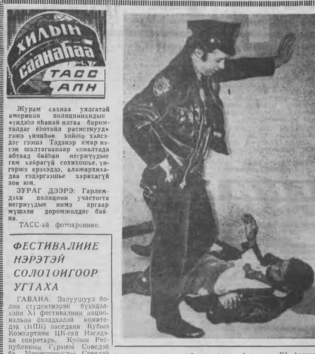
Журам сахиа уялгатай американ полициинхиды «үндэнэ яһанай илгэа баримталдаг ёһотой расистууд» гэжэ үншнөө хойно хэлсэдэг гэшэ. Тэдэнэр ямар нэгэ шэ шалтгаанаар хилалтада абтаад байһан негрүүдэ гэм хайрагүй сохихыс, үнгэржэ эрхэдээ, алажархиадаа тэдэргэшысэ харахагүй зон юм.

Журам сахиа уялгатай американ полициинхиды «үндэнэ яһанай илгэа барим- талдаг ёһотой расистууд» гэжэ үншнөө хойно хэлсэ- дэг гэшэ. Тэдэнэр ямар нэгэ шэ шалтгаанаар хилалтада абтаад байһан негрүүдэ гэм хайрагүй сохихыс, үн- гэржэ эрхэдээ, алажархиа- даа тэдэргэшысэ харахагүй зон юм.