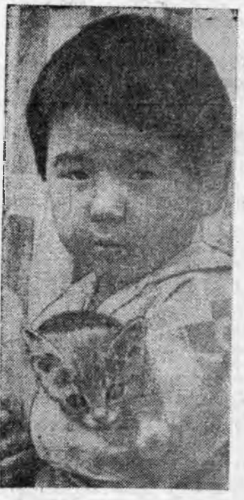
Алтан зула сэсэгтэ Аажам зунай хаһада Аятай зохидоноор Амархада хайхан даа. Ангир шара наран Аяар дөөрөөг шараад Миний хөөрхэн хани Минсэйг эхээр халуудаа. Годруулган урднан Горхон дээр ошомоний Ураскал долгинтой Урлдажа наадахамнай. Е. СУРМАЧАЙ фотозтод.

НАЙДАЛ. Ямар хайхан үгээ. Шүлдэг бадаг соо, дуунай аяла соо эдэлхэн үгэ. Сэдхээлэй найдал. Нанай найдал. Инар дуунай найдал. Зурхад дугээр, нолдны уринаар харагдахан хүнд найдала. Аналай ариун хубшэргэе бата найдамтай гарнууда найдала. Холын хүшэр замда, харгын хатуу бэрхэдэ хани нүхэртөө найдалга. Ургэж үндылгээн үри хүүтэдэй хүнэй сэргэ баха бэээ, сэсэгн нэрэ са- хиха бэээ гэжэ эмгэн буу- рал эхэн найдалга. Нарата сагаан дэлхэй дээр найда- жал ябахан наһамнай.