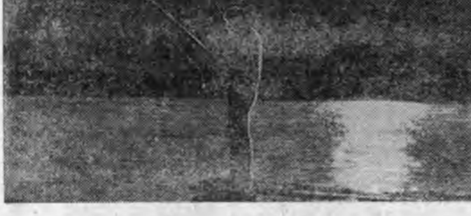
Удэшын татаса олзотой...

Долоот заахан Догдой Дотор самсаараа олодон, Домбогор уралаа хүдэжэн, Долоон үбгэдэ адаглан, Дөлөөбор хургаа тэннйялган, Дорюун яисаар зааха юм. Эрхмн дууша хухыдөө Эгэ банн гэдэгдэ. Энэ дэлгэр байгаади Нимэ домбо бэлдэ гү? Урхан энэ домбын Уяхан эшэнэе барихада, Шанагын түхэлтэй юм байна. Далаа даһан табайн Данше хэрхо Догдойгоо Бээдэ няжа хэлэнэ. «Бэрхш. Толгойгоо үндүүлэ». Найган байжа дчулаха, Нугаран сайжа урха. Нимэ урхан домбоор Эжэл багханн хүдэлтэе Гүн сэсэингээ дундаһе Бэлэг болгон барнайб.