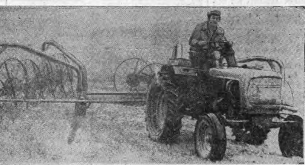
ФОТО РЕПОРТАЖ САБШАЛАН ДЭЭРЭ...

Газетний 1921 оной декабрин 21-нээ гарана № 186 (14908) 1978 оной августын 12, суббото Сэн 2 мүнэн.