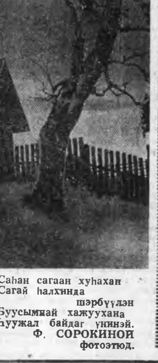
Саһан сагаан хунахан Сагай халхинда

СЭНХИР ЭКРАН НЭГЭДЭХИ ПРОГРАММА «Орбита-2». 7.55 — Дамжуулгын программа. 8.00 — «Время». 8.35 — Ургэһэй гимнастика. 8.55 — Түрэлхидтэ зориулагдана дамжуулгата. 9.25 — Л. Н. Толстой «Залуу наһан», жүжэг (3-дахы хуон). 10.55 — Ургэһэй «пачо» — хүнгэмтэ программа. 11.25 — «Найн шарнартэй эд бара элбэг эхээр таргах». 11.55 — «Спорттогой» тираж. 12.10 — «Музей ба выставкын залнуудар». 12.40 — «Элдэр энхэ байта». Улаан-Удэ. 13.25 — «Хөөрхөн үгтэ» — һурагшадта зориулагдана дамжуулгата. 13.45 — Тарха хуралдада хабаагдана зориулагдана дамжуулгата. 14.25 — «Хамар-Дабан» гэжэ аяншалгын клуб. «Орбита-2». 15.15 — «Ульдэргэ мэтэ дэлхэй» — телевизион хуүгэмтэ фильм. 15.40 — «Советсн Союз тухай харин гурнэй айлдаһаа һанамжа». 16.00 — «Шалпа-невидимка». «Глеяго өвидел». «Край и транзитуд ба космонавты хай совет композиторы дуунуул». 13.45 — «Хамар рисан» — телевизион хуүгэ үдэр. Телевизион таһанад шадаха.