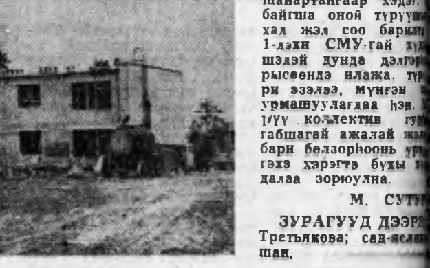
М. СУТОВА ЗУРАГУУД ДЭЭРЭ Третьякова; сад-яслын шад.