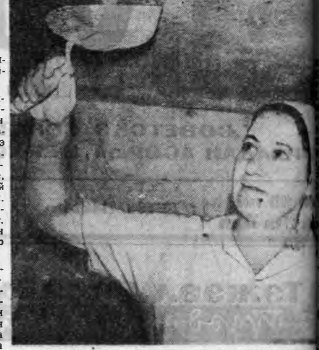
ШТУКАТУРДАА 14—15 МЕТРГЭ ХУРГАХА ЮМ. БУХН АЖАЛГАЙ НАНАРТАЙГААР ХЭДЭ БАЙГШАА ОНОЙ ТУРУУН ХАЛ ЖЭЛ СОО БАРИЛГА 1-ДХН СМУ-ГАЙ КВАРТАЛ ШЭЛЭЙ ДУНДА ДЭЛГЭРЭР ШӨНӨНДЭ ВЛАЖА. ТЭРЭ ЭЭЛЭЭ, МҮНГӨН УРМАШУУЛАГАА НЭ. ТУРУУ КОЛЛЕКТИВ ГҮРГЭГЭЙ ГАШУУ АЖАЛАЙ ЖЭЛ БАРИ БЕЛӨРӨНӨН ТУРАА ГЭЖЭ ХЭРЭГТЭ БҮХН ДАЛАА ЗОРИУЛАА.

Л. Н. Кузнецовагай хүтэлбэришад бригадын коллектив 43-дахн кварталда баригданан сад-яслын байшангай дотор галын худэлмэришад. Бригадын гэнүүд хүн бүрлөө халаанай туршада 12 дүрбэлжин метр хана