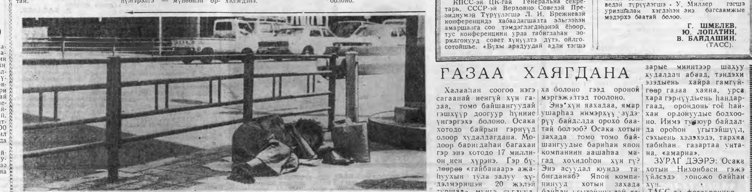
Халаан хаягдана Халаан хаягдана Халаан хаягдана