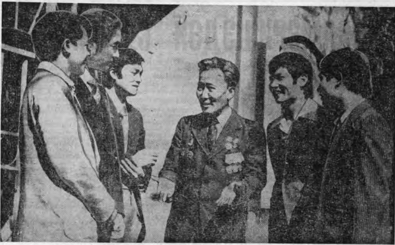
Урдын сагай монетэнүүд