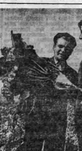
Удаань нүхэр А. Д. Моголов тугэхэлэй үгэ хэлээ. — Ингэжэ мунөөдэрэйхидэл адляар дүй дүршлээ андалдана...