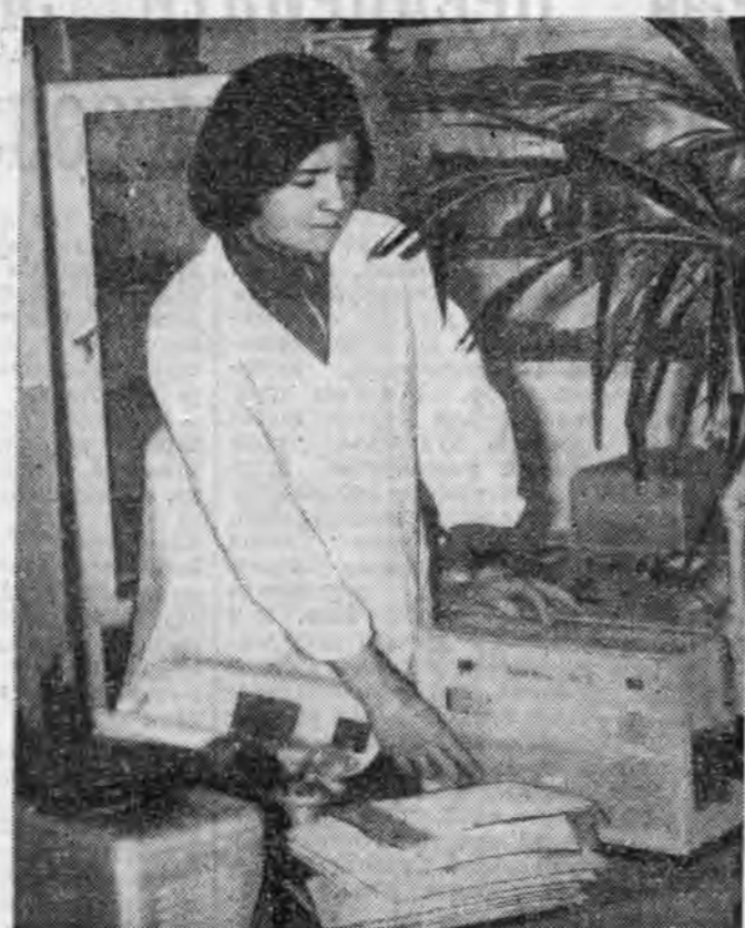
Г. ДАШЧЕВА. «Бурмедтехник» магазин соо.

Тухай мэрэгжэлтэйшүүл дээдэ, тухай дунда хургуули дүүргэһэн хүнүүдшье олон. Медицинскэ институтудай дэргэдэ медтехникын факультет нээгдэхээр хараалгадһан хай. Энэ зорилгон бөлүүлдэгдэл хаа һайн байгаа.