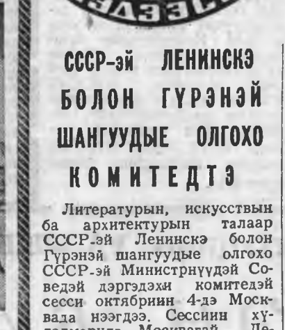
СССР-эй ЛЕНИНСКЭ БОЛОН ГҮРЭНЭЙ ШАНГУУДЫЕ ОЛГОХ КОМИТЕДТЭ