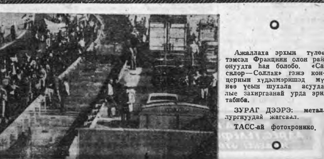
Ажалдаа эрхын түлөө тэмсэл Франциин олон рай- онуудта һаа болобо. «Са- сийор—Солла» гэжэ кон- ференци хүдлэмэриншад мүн- өө үшнэ шулаа асуудла- дыс захиргаанай урда эрилтэ табина. ЗУРАГ ДЭЭРЭ: метал- лургуудай жагсаал. ТАСС-ай фотохронико.

Араб арадуудай ара талада США- гай, Израилин ба Египедэй шуоуаар хэһон үгсөөнэй дүнгүүд шуһата муу- шай сууряан боложо, Ливанда соносто- бо. Сададад бөөс тушааһан политикаар, Израилин эзэрлэг түрмэхэйшүүдэй шэнэ буулгануудар урмашан зоригхо- һон Ливанай хархис хүснүүд Бейруттэ шэнэ зэбсэгтэ тэмсэл үү- хэбэ. Граждан дай болуулаха зорилго- тойгоор ороң дотор ерүүлэгдэһэн, гол түлөө Сирийн сэрэгүүднэ буридуулгэ- дэһэн арабууд хоорондын хүснүүдэй эрхэ түлөөлөгтэ нунаахыс Ливанай засагаархидай арсаха гэгһэн эрилтэ элэһэй удамарша — консервативна «Ливанай фронт» гэдэг эмхин түрүү- лэгшэ К. Шаамун табһан байна. «Сирийн һүүлшын содадад Лива- най газар дээрэнэ гаража ошоторнь» тэмсэлэе үргэлжүүлхэ гэгшэ «фрон- тыс» гол зорилго болон гээд Шаамун сонособо. Хэний тухиралгаар ингэжэ хэлхэһыннэй ойлгохоор юм ааб даа. США- гай, Израилин, Египедэй, Саудовска Аравийн, Ливанай хабаадалгатайгаар Ливанай асуудалыс шийдхэхэ уласхоо-