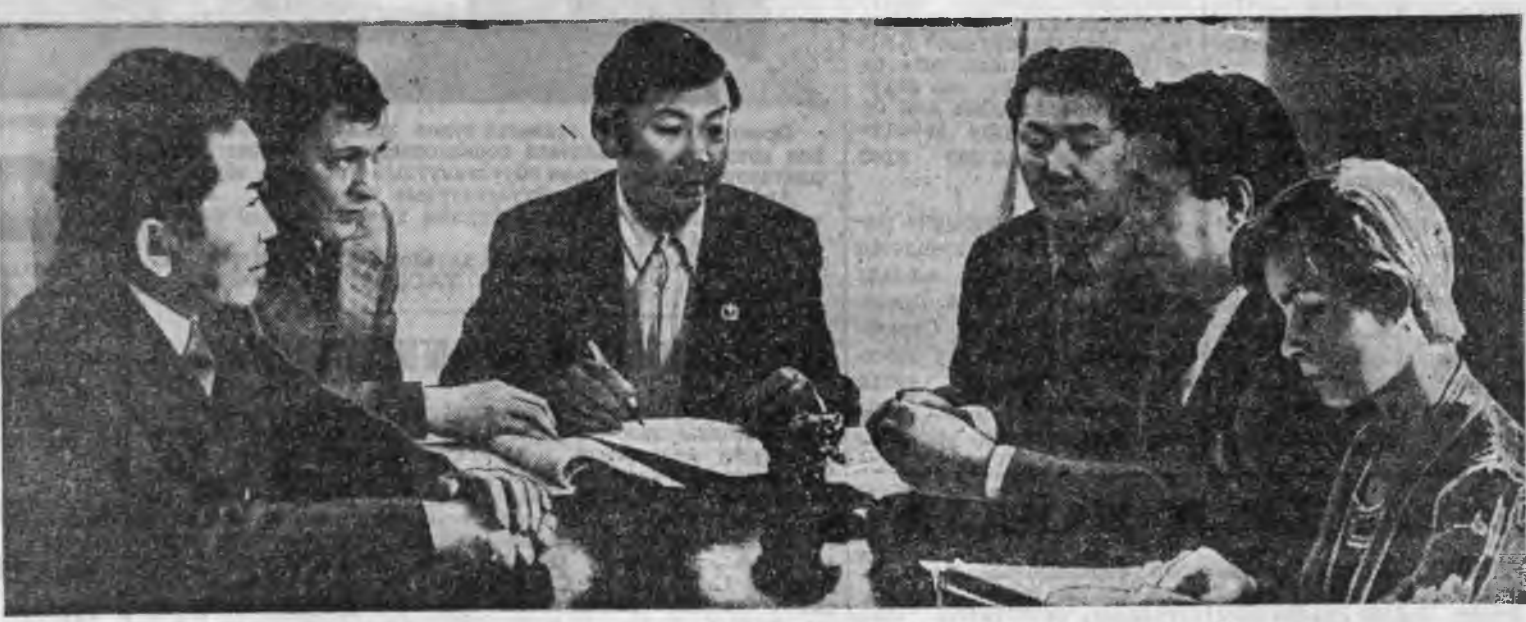
«Байгал» журналай редколлегиин ээлжээтэ заседани боложо байна.