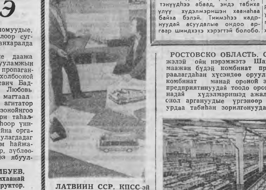
ЛАТВИН ССР. КПСС-эй XXV сьездын нэрэмжэтэ Елгавака «РАФ» гэжэ автобусой заводто шэнэ түхэлэй машинануудые зоёхохо хүдэлмэри үргэнээр абуулагда...