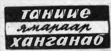
Таниие ямаргаар ханганао

ГЭР ОРОН ОЙ АЖАЛДАА БИГША ОН ОЙ ЗУН РЕСПУБЛИКЫНГАА 30 ЖЭЛЭЙ ОЙН БААРЫ ТӨМӨГДӨХЭН.