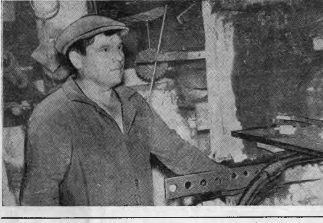
Улаан-Удын шэлэй заводой машинно-вайна цехэй гурба-дахим халаанда хүдэлгээшд шээ зүлгээ жэлэйнгээ түсэб-тэ даавари үлүүлэн дүүргэбэ, нүүлэй үедэ үйлдэрилгэдэ-һэн продукцияг шаар нилээд найжараа юм.