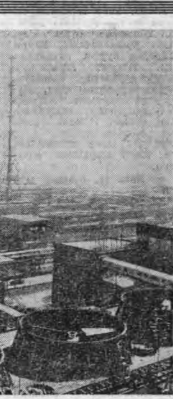
УЛААН-БААТАР. Нислэ-лэ хотын ажалшадан парти-но-ажахын эдэбхитэдэй суг-лаан боложо, тэрэнде ха-баалгаша үйлдэбэрин ашаг үрэ ба бүтээн гаргагдаг