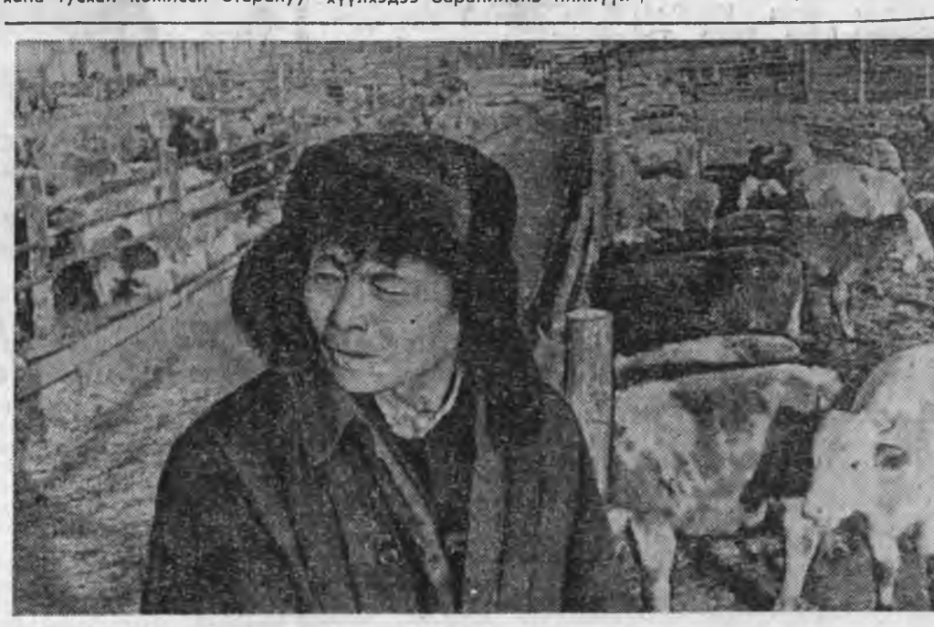
ШЭГНҮҮРЫНЬ ЕХЭЭР НЭМЭЭНЭ

дээр ябажа, бэлдэхлэнь шалгаа. Хонишодой бүхы бригаданууд һайн бэлдэлтэйгээр халуун хахаа угтаһан байба. Юрий Парашютисткийн отара Нархатын эхиндэ үблэжэ дэг юм. Энэ хонишон үбһэ бэлдэхлэгдэ эдэбхитэйгээр хабдажэ, 500 гаран центнер һайн шанартай бүдүүн тэжээл газараа оруулһан байна. Түл абалгада эрхимүүд бэлдэһэн хадаа мүнөө табан зуу гаран хурьга һайнаар түлжүүлнэ. Хурьга абалга энэ отарада үргэлжлөөр. Зуун эхэ хонин бүриһөө дунда зэргээр 110 хурьга түлжүүлгэ зорилготойгоор тус бригада үдэр, һүнигүй оролдоно.