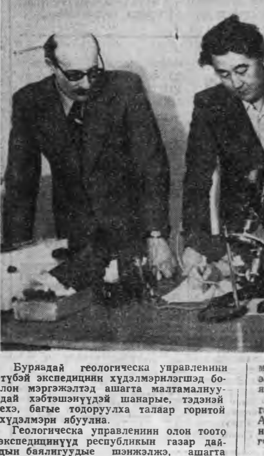
Буряадай геологическа управлениин түбэй экспедициин худалмэрилгэгшэд болон мэрэгжэлтэд ашгата малтамалануудай хэбтэһэнүүдэй шарны, тэдэнэй ехэ батые геологуулаха талаар горитой худалмэри абуулна.