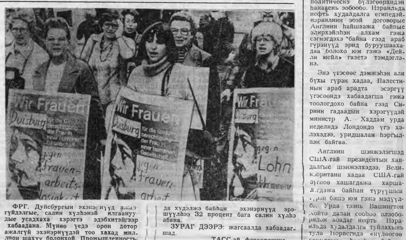
ФРГ. Дуйсбургын эхэнэ нүүд алаа гүйдэлые, салин хүлэһэй илганууды есадаха хэрэгтэ эдэбхитэйр хабаадана. Мүне үедэ орон дотор ажалгүй эхэнэ нүүдэй тоо хахад миллион шаху болоной. Промышленность да хүдэлжэ байһан эхэнэ нүүд эршүүдтэ 32 процент габэ салин хүлэ абана.