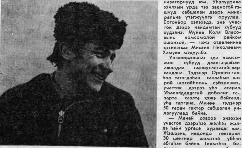
Хабарай игабарни наранда хайланагай улан беган-хонхонуд болсог, на-руули набар гээр рүү шуу...