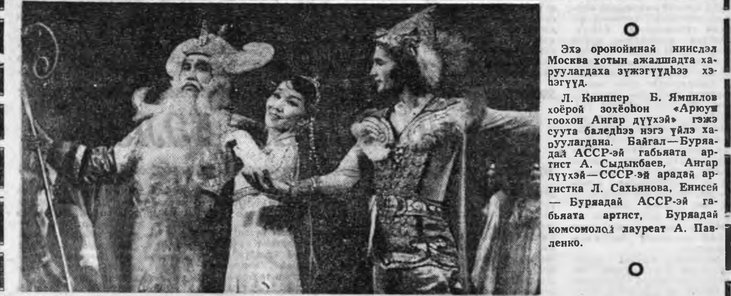
МОСКВАДА ҮНГЭРГЭГДЭХЭЭ БАЙГАА ГАСТРОЛИН УРДА ТЭЭ

Парти, правительстванай эрдэм нарын хүжэлгэдэ саг үргэлжин анхрал хандуула. Эрдэм нарын гол асуудалуудта зориулагдана. Энэ хэдэн олон тогтоолууд баталагдан абажа, эрдэмтэй шэнжэлгын хүдэлгэи оронной эрдэмтэй эмхи зургаануудта үргэн дайласатайгаар ябуулагдана.