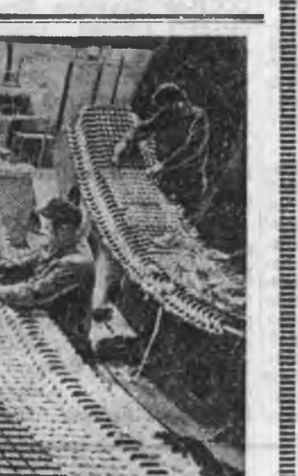
Хэрэглэхэ оньһон түхээрлэнүүд олоор бүтээгдэ. ЗУРАГ ДЭЭРЭ: Зейскэ ГЭС-тэ худалгалгыз 6-дах машинын статор хабсагдажа байна.