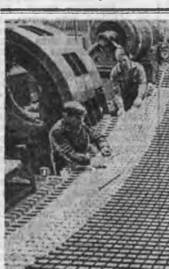
Ленинград хотын ажалшад Сибирь болон Алас-Дурна зүгэй ажилчуудые болзорноон урид дүргэхэ уриа дор ажаллана...