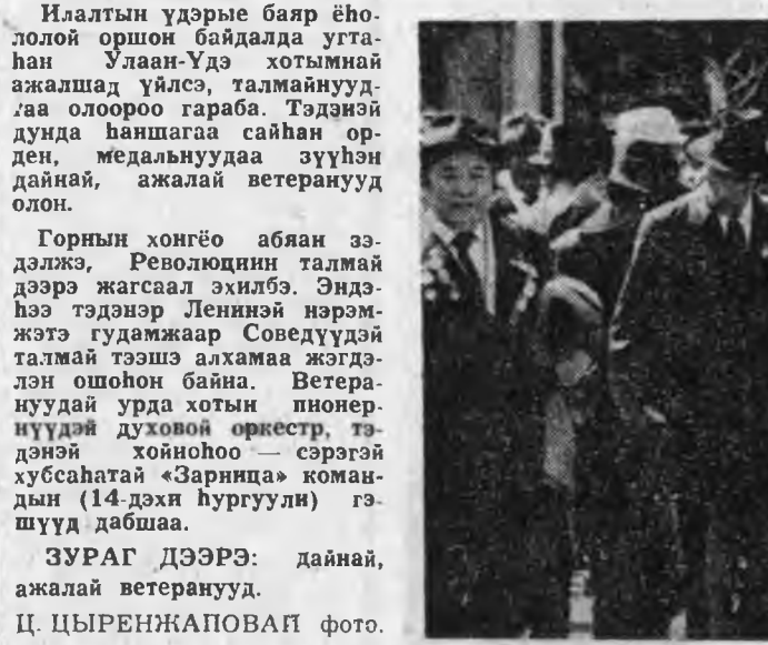
Илалтын үдэрне баяр ёһололой оршон байдалда утгалан Улаан-Үдэ хотымнай ажалшад үйлэс...