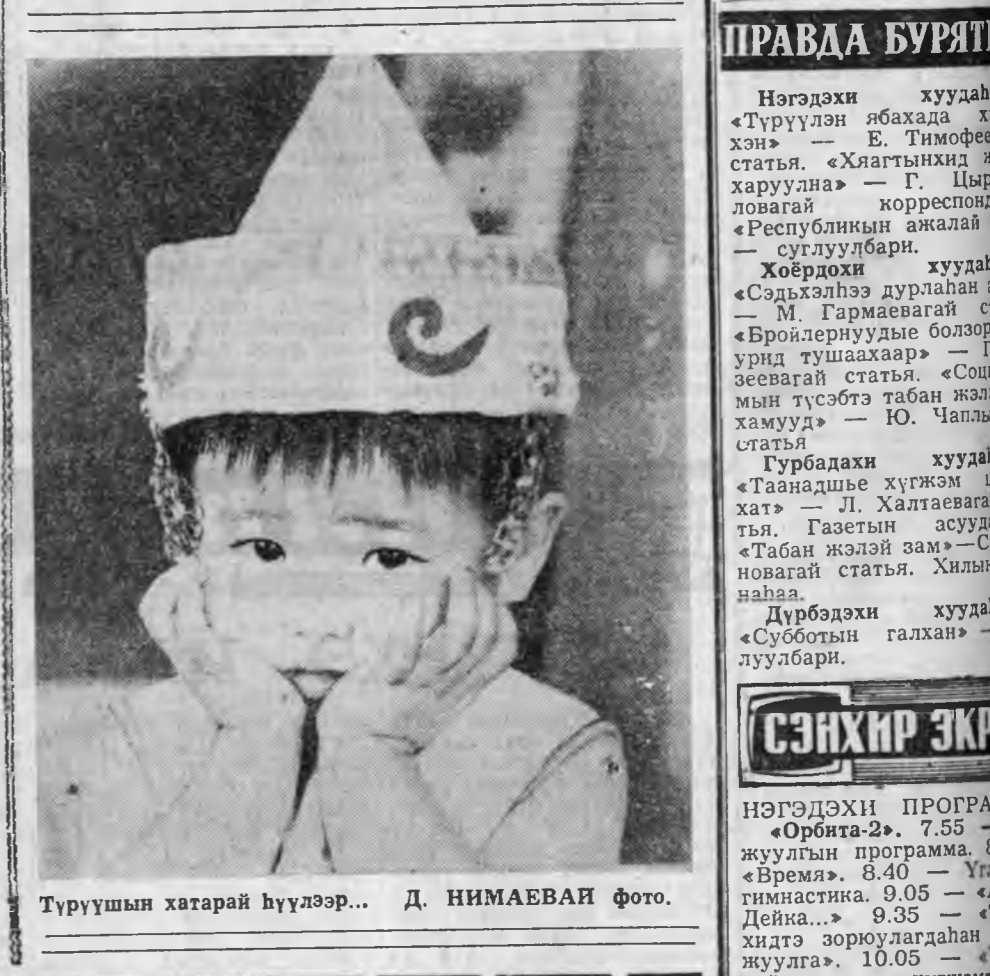
Түрүүшын хатарай һүүлээр...