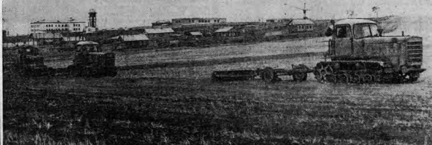
Удэр Энхэ Талын наа-рмынхид зуһаландаа гүжэ хул хөөрсг боло-мэ хэн. Ээһиньшэ бай-аб даа.

ЭХЭНГЭ. Газарай хурьһа хамгаалах тал нүүдэй жэлүүдэдэ эйдэ тоно хүдэлмэри ябуулагдана. Илангаяа Хэжэнгийн совхоз механизаторнууд талынгаа бүхы полине хуруулан, хурьһынь урбуулан халхалжа онд арга өөр хэрэглэнэ.