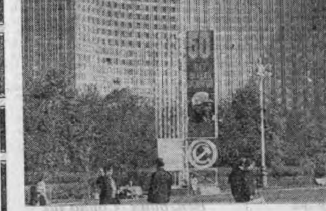
МОСКВА. Олимпийн XXII наадануудай түлөөлөгшэдэй байха оронолүүдэй ороной нислэг хотоодо олоор баригдана. 10 мянган хүнэй байха Измайловодои комплекс, туристын байшан, Ленинскэ проспекти «Севастополь» гостиница тэдэнэй тоодо ороно.