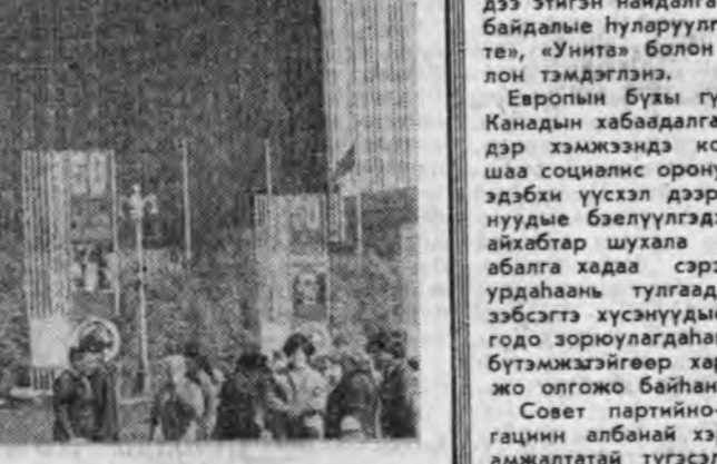
МОСКВА. Олимпийн XXII наадануудай түлөөлөгшэдэй байха оронолүүдэй ороной нислэг хотоодо олоор баригдана. 10 мянган хүнэй байха Измайловодои комплекс, туристын байшан, Ленинскэ проспекти «Севастополь» гостиница тэдэнэй тоодо ороно.

ЗУРАГ ДЭЭРЭ: 3500 хүнэй байха «Космос» гостиницын юрхын талд, ТАСС-ай фотохронико.