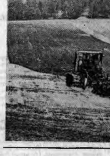
Байгша ондо Анаагай совхозой механизаторнууд 1300 гектарта шэнисэ, 1800 гек-тарта оббос тарьяан юм. Мү-нөө эртын орооһото ургамал-нууд нэртэ хүргдээр уржа-жа халаха.

Хүйтэн ударилтай манай эндэхи нотагта тарилгын хүдэлмэрине түргэн болзорто үнгэргэхэ гэжэ бэлэн бэшэ юм. Хэдэн үдэр дулааржа байһан аад, дахиад хүйтэр-жэ, намарай гү, али эртын хабарай шэнжэ ородог.