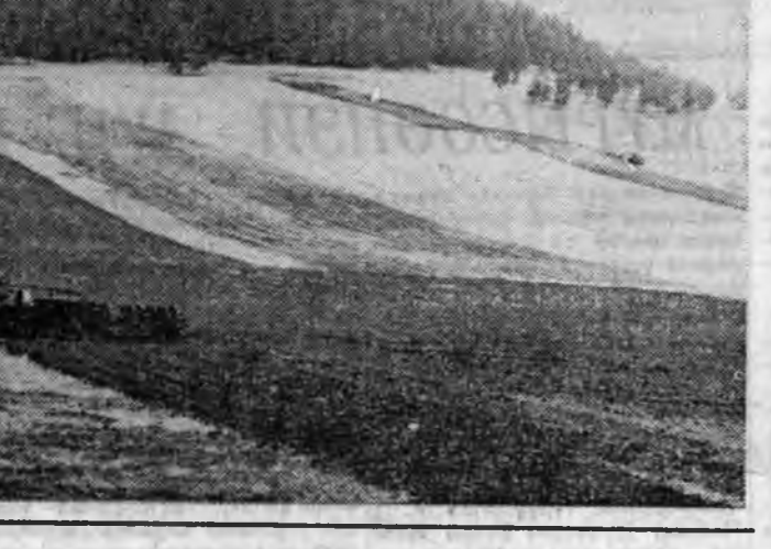
Мүнөө совхозой механизаторнууд хартаабха һуула-жа дүүргэхэ дүтлөө. Улаань тэжээлэй ургамалнууды тар-иха захалха юм.