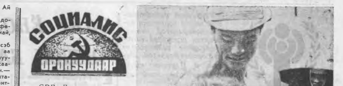
СРВ. Дахинаа амгалан тайбан ажабайдалаа эхлэн социализм Вьетнамай ажалшад оройнонгоо...