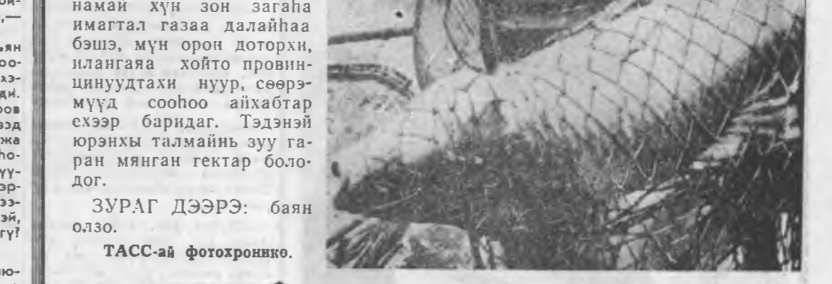
ТУРАГ ДЭЭРЭ: баян оло.