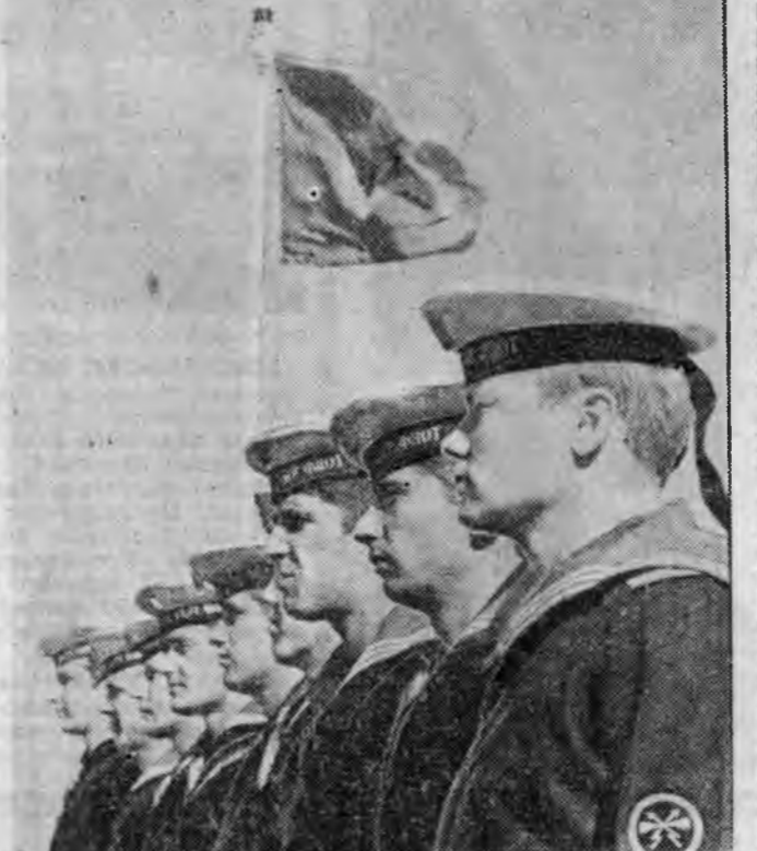
Хөёр дахин Улаан тугта Балтин флодой сэргэй морягууд заншалта һайндэрне эхэ дэбжээлтын оройн байдалда утгана. «Социализмын туйластануудыне һаргэ һэримжэйгээр хамгаалха, дайшалхы бэлдэхэлэе ба сэргэйнгээ шадабэрин хэмжээ дэвшүүлхэ» гэһэн уяра дээр тэдэрин социалис мурсысөө үргэнөөр дэлгэрүүлэнхэй.