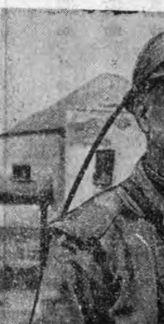
хүндэ хүшэрые оньхожоруулна. Эдэ бүгэдын бригадын гашүүн бүхэн аяар 4 мэрэгжэлтэй...