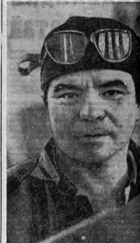
хүндэ хүшэрые оньхожоруулна. Эдэ бүгэдын бригадын гашүүн бүхэн аяар 4 мэрэгжэлтэй...