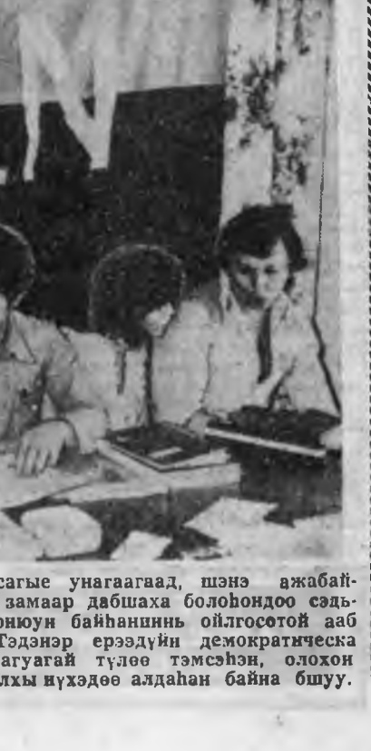
Никарагуа. Сандинын нэрмэжтэ Национална сүлөөрлөгшын фронтын делегатин гэшүдэ ФНОС-ой туг доро Парижихи Никарагуагай консульстводо сугларад байна. Элээнэй баярай хүхюун шарай харахада, Сомосын шуна