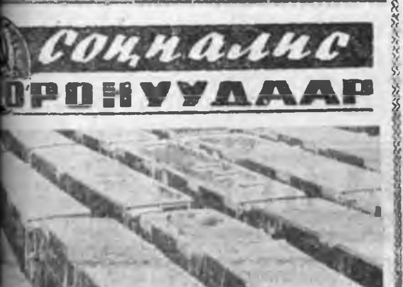
Советскэ Союз Венгрийн Арадай Республиканы хоёрно хоорондо бата бэхи экономическа харилсаа холбоон тогтоогдонхой юм.