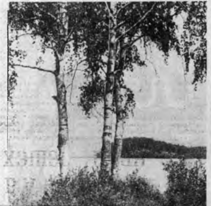
Котикель нуур дээр П. ЯХНОВЕЦКИН фототөүд.