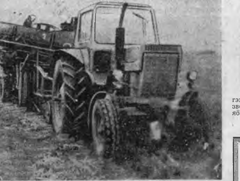
Турүүшын 5 хоногой туршада тус авено 42 гектарай ургаса суглуулаа. Гектар бүриөө 95 центнер хартаабахуа абтана. Энэ зундаа ган гасуур байжа гектарай 120 центнер хуряажа...