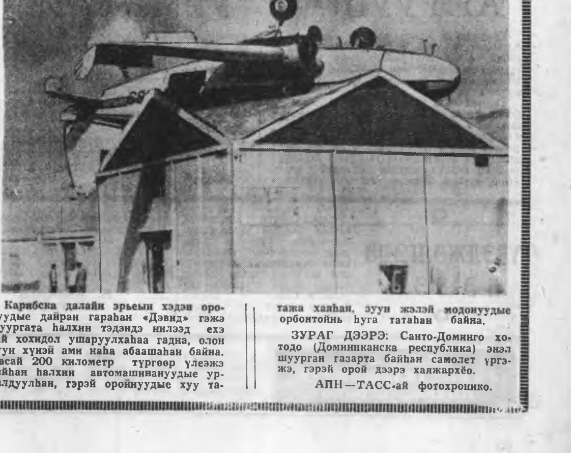
Карибска далайн эрэмын хэдэн оронундаа даян гарабан «Дэвид» гэжэ шуургага халһан тэндэй нилээд эхэ гай хожидол ушаруулаха гадна, олон зуун хүний ами наһа абаһан байна. Часай 200 километр тургөөр үлэжэ байһан һалхын автомашинуудыг урбалдуулан, гэрэй оройнуудыг хуу татажа халһан, зуун жэлэй модонуудыг оройтоһын хуга гатаһан байна.

Экономическэ түбэг бэрхшээлүүдэ зайсуулаха тэмсэлэй түсөөбэ тус парти нахан зохиён хараалхадаа, гол түлээ ажалшан арадай аша туһаар гаралсакыг ханаашалһан байна гээд И. Енсен мэдүүлбэ. Импатал болзооро урид үнэргэгдэнэ лунгалта коалицион правительствын хүтэлбэрлгыг зайсуулаха, ехэ капиталтай засаг захиргааны хизаарлаха шадха гээд пленум дээрэ абтаһан мэдүүлгэ дотор тэмдэглэгдэнэ.